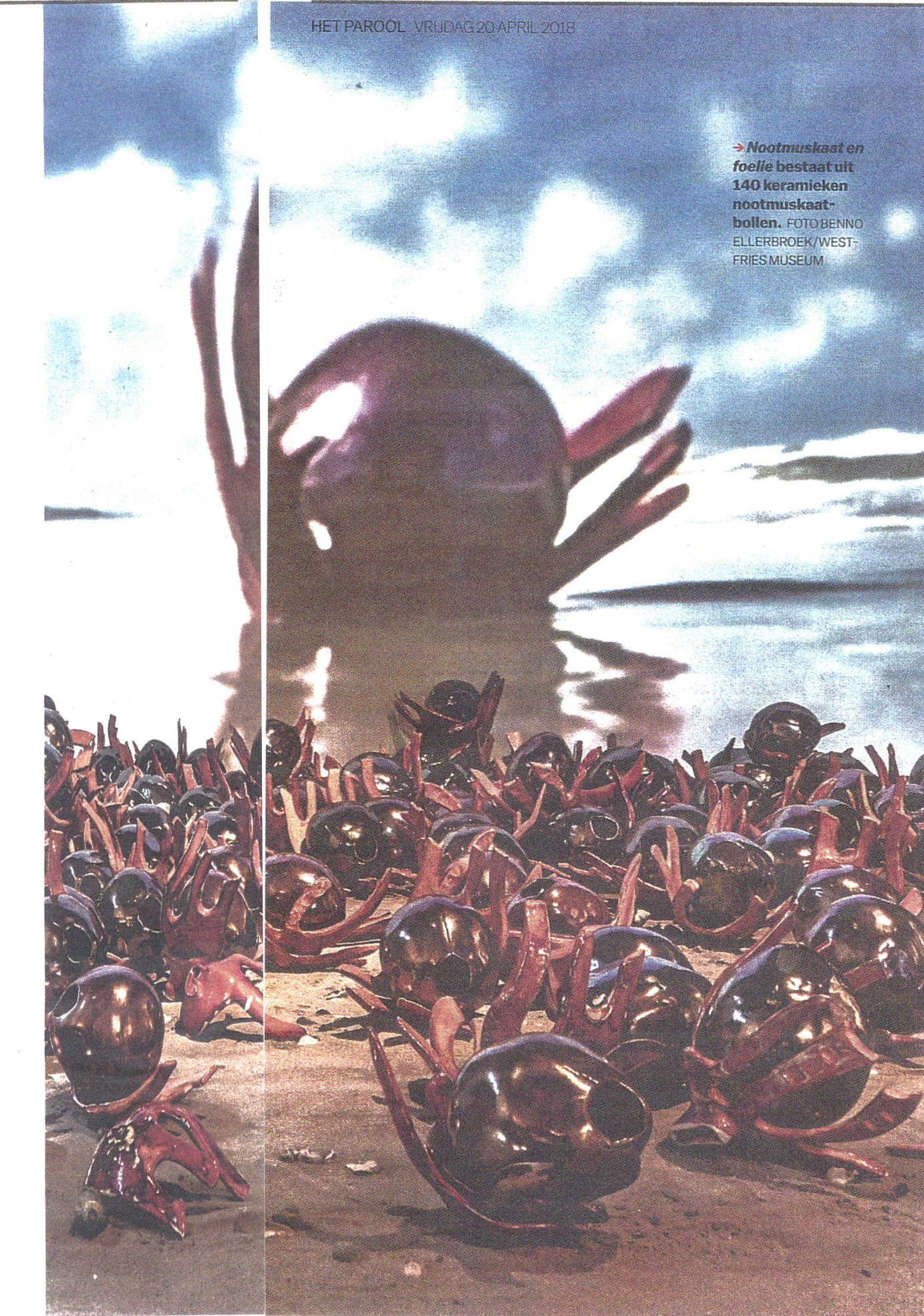
→ Nootmuskaat en foelie bestaat uit 140 keramieken nootmuskaatbollen.

Het verbinden van verleden en heden gebeurt onder meer met het kunstwerk Nootmuskaat en foelie . Tineke Fischer maakte 140 keramieken nootmuskaatbollen die op een prominente plek in de VOC-zaal zijn uitgesteld. Op een zandstrand, tegen de achtergrond van een metershoge projectie van een zee met wilde branding. De aangespoelde nootmuskaatbollen zijn een verwijzing naar de slachtpartij die onder leiding van Coen werd gehouden onder de oorspronkelijke bevolking van Banda om het monopolie op