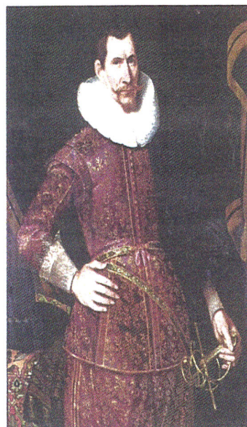
→ Werken uit het museum. Onder: Coen.

vanwege de duizenden slachtoffers die hij in opdracht van de VOC had gemaakt tijdens de kolonisatie van Indië. De gemeoederen tussen voor- en tegenstanders liepen hoog op. Het museum gooide de programmering om en organiseerde in korte tijd een compacte expositie in de vorm